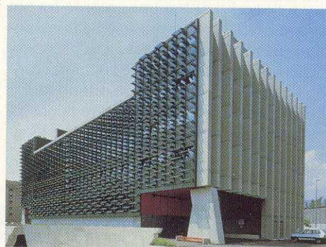
Facciata metallica CPI a Locarno

Grazie al progetto degli architetti Franco e Paolo Moro, siamo riusciti a offrire un volto moderno e significativo anche al lato verso Via Franzoni che si completa con quello esistente su Via Pioda. Il nuovo contenitore ha sollevato molto interesse. Al suo interno trova posto un'officina moderna, luminosa, pulita e attenta all'inquinamento fonico. Tutto l'insieme è oggi all'altezza di un'azienda moderna: attrezzature, servizi, locale mensa... Qui operano i nostri collaboratori che, senza retorica, restano il bene più prezioso dell'azienda. Siano essi tecnici, operai, apprendisti, amministratori. È proprio il personale che garantisce il bagaglio di conoscenze necessarie ad una produzione tanto vasta e diversificata qual è la nostra. Proprio per sottolinearne l'importanza abbiamo inserito nella nostra pagina web ( www.giugni.ch ), l'elenco completo di tutte le persone che hanno collaborato con noi, non importa se per poco o molto tempo, dal 1925 ad oggi.