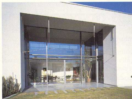
Struttura e serramenti in una villa a Losone *

Serramenti con gamme da anni studiate e sviluppate da noi: finestre, finestre scorrevoli, porte, portoni, ecc. Facciate in metallo-vetro. Opere da fabbro quali ringhiere, parapetti, scale anche qui di ogni tipo e dimensione. Fabbrichiamo pure molte altre cose, dalle cabine di attesa dell'autobus alle paratie anti-essondazione (a salvaguardare i beni dalle sempre più frequenti fuoriuscite del nostro lago). Siamo attivi nel campo della sicurezza – viepiù importante, considerato l'aumento dei furti – e nel campo delle misure antincendio. La nostra forza consiste nell'essere riusciti a creare una struttura capace di esaudire ogni esigenza. Possiamo così soddisfare il cliente in cerca di una piccola ringhiera, di una lamiera piegata, dei serramenti per la propria abitazione, ma sappiamo corrispondere anche ai bisogni della grande committenza con entrate automatizzate, scale e scaloni, facciate per palazzi e tanto altro ancora. Insomma, conserviamo una tradizione nella lavorazione dei metalli esplorando però continuamente nuovi ambiti dove applicare le nostre conoscenze: ottant'anni, ma pronti a tutte le nuove sfide.