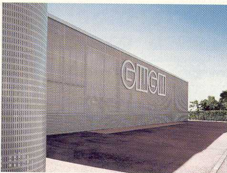
La nuova sede della Giugni SA *

Effettivamente, è una scelta per certi versi anomala perché dettata più da considerazioni affettive che economiche. Ogni volta che abbiamo proceduto ad ampliamenti o interventi importanti ci siamo chiesti se non fosse preferibile trasferire l'azienda in una zona industriale e lasciare libero il terreno per insediamenti abitativi. Da un punto di vista strettamente economico questa sarebbe indubbiamente stata la scelta più ragionevole. D'altro canto però, ciò avrebbe significato abbandonare Locarno, mentre noi ci sentiamo intimamente legati alla storia di questa città. Va detto che la nostra scelta è sempre stata apprezzata dalle autorità cittadine.