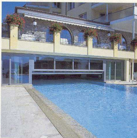
Serramenti Albergo Eden Roc ad Ascona *

L'ultimo ammodernamento ha offerto un'elegante facciata su Via Franzoni. Questa struttura chiusa ha suscitato curiosità riguardo al suo contenuto.