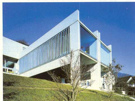
Serramenti e pale frangisole in una villa a Orselina *