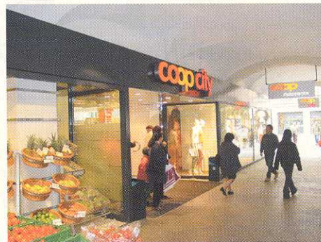
Entrata Coop City in via Nassa a Lugano