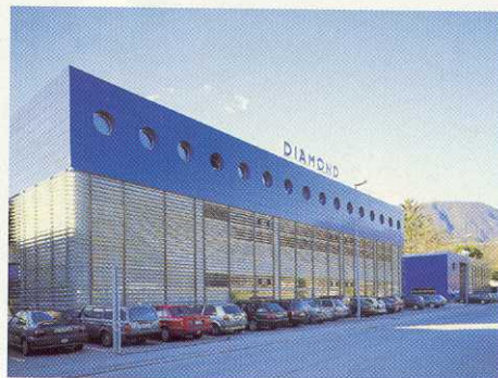
Facciata Diamond SA a Losone *